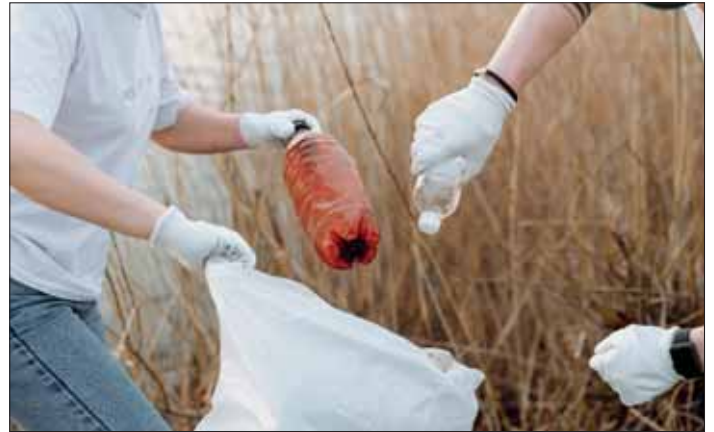
Der Ortschaft und Umwelt gutes tun.

Auch in diesem Jahr sind im Rahmen der Umweltwoche, an