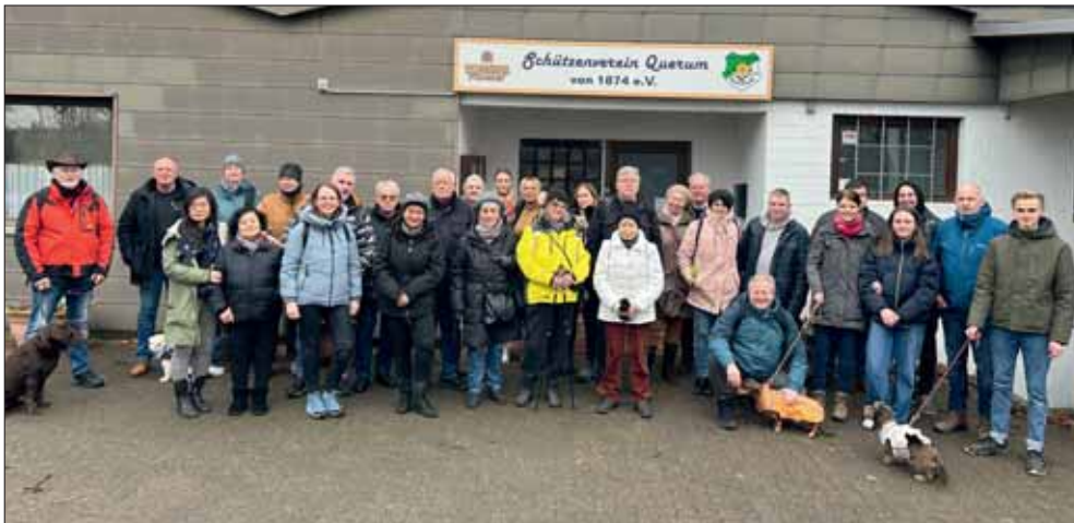
Ein Teil der Teilnehmergruppe der Braunkohlwanderung.

mit einer Exkursion zu den Bunkern im Querumer Forst