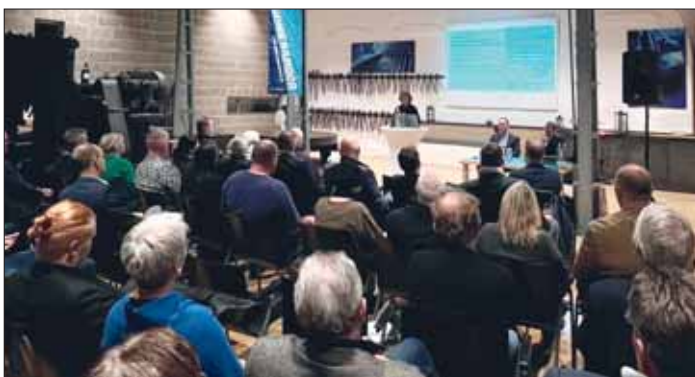
Blick aus dem Zuschauerraum.

Bundesgesundheitsminister Karl Lauterbach plant in Zusammenarbeit mit den Ländern eine große Krankenhausreform. Hierbei sollen sich die Krankenhäuser stärker auf bestimmte medizinische Bereiche spezialisieren und dementsprechend in Leistungsgruppen einsortiert werden. Es wird sich davon eine höhere Qualität an den einzelnen Standorten versprochen. Für das Städtische Klinikum ist auch die Abkehr vom Fallpauschalen-Prinzip wichtig. Aktuell hält Braunschweig für die Region zum Beispiel