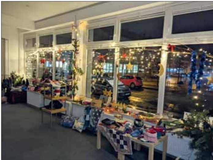
Der kreativ gestaltete Basar.