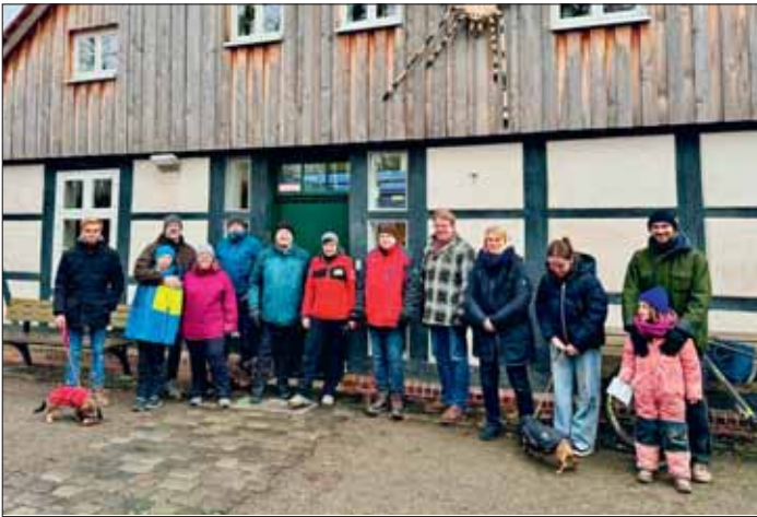
Die Wandergruppe am Haus Entenfang.