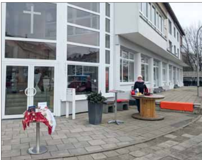
Eingang zum Basar bei der Freikirche.