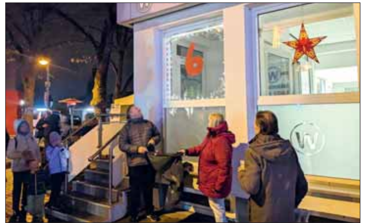
Reges Interesse beim lebendigen Adventskalender.

Nach der durch Corona bedingten Pause fand wieder ein Lebendiger Adventskalender in Querum statt. Ein Organisationsteam sprach ehemalige und auch neue Veranstalter an, die meist mit Freude wieder ein „Türöffnen“ gestalten wollten. In bewährter Weise wurden jeden Abend vom 1. bis zum 23. Dezember durch Privatpersonen, gemeinnützige Organisationen und Firmen Glühwein oder Punsch und Kekse oder andere Leckereien, wie beispielsweise Schmalzbrote, angeboten. An manchen Orten wurde gesungen, mudiziert, etwas Besinnliches vorgelesen oder feierlich ein geschmücktes Fenster mit der Zahl des jeweiligen Tages geöffnet.