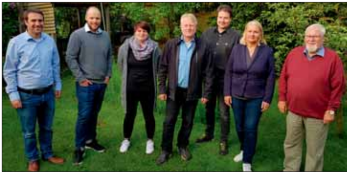
Bezirksratsmitglieder des Stadtbezirks 112.