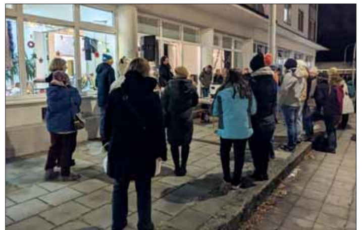
Miteinander ins Gespräch kommen.

Nach der durch Corona bedingten Pause fand wieder ein Lebendiger Adventskalender in Querum statt. Ein Organisationsteam sprach ehemalige und auch neue Veranstalter an, die meist mit Freude wieder ein „Türöffnen“ gestalten wollten. In bewährter Weise wurden jeden Abend vom 1. bis zum 23. Dezember durch Privatpersonen, gemeinnützige Organisationen und Firmen Glühwein oder Punsch und Kekse oder andere Leckereien, wie beispielsweise Schmalzbrote, angeboten. An manchen Orten wurde gesungen, mudiziert, etwas Besinnliches vorgelesen oder feierlich ein geschmücktes Fenster mit der Zahl des jeweiligen Tages geöffnet.